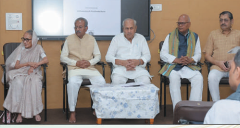
संगोष्ठीच्या उद्घाटनप्रसंगी मंचासीन मान्यवर

स्थळ : श्री महावीर ब्रह्मचर्याश्रम (जैन गुरुकुल), कारंजा (लाड), जि. वाशिम ४४४१०९