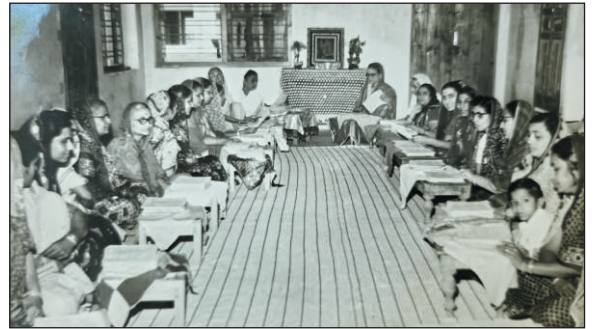
सुमारे ७०च्या दशकातील कंकुबाई श्राविकाश्रमातील महिला स्वाध्याय वर्गाचे छायाचित्र

सरतेशेवटी आद. ताईच्या व्यक्तिमत्त्वातून व संचालनाच्या माझ्या अनुभवातून सांगावेसे वाटते की, दूरदृष्टीसोबतच प्रेम, संयम, संवेदनशीलता आणि सर्जनशीलता यांचा संगमच लहान बालकांच्या सर्वांगीण विकासात खऱ्या अर्थाने यशस्वी ठरतो, आनंददायक ठरतो. याची प्रचिती तेव्हा येते, जेव्हा सत्तर वर्षे पूर्ण केलेल्या या शाळेतून शिकून गेलेले व आता आजोबा झालेले आमचे माजी विद्यार्थी आपल्या मुलांना व त्यानंतर आता आपल्या नातवंडांनाही याच बालवाडीत शिकवण्यासाठी आग्रही असतात...! ●●●