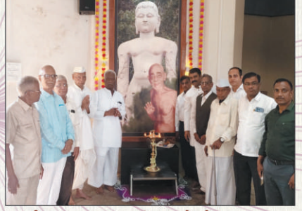
बाहुबली गुरुकुल स्नातकांच्या स्नेहमेळाव्याच्या दीपप्रज्वलनप्रसंगी उपस्थित मान्यवर (विशेष वार्ता पृष्ठ क्र. ४४वर)