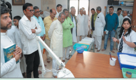
पाण्डुलिपीच्या संरक्षण कार्याचे अवलोकन करताना उपस्थित विद्वत्वरग