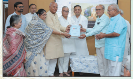
सर्वार्थसिद्धि : एक अनुशीलन - या ग्रंथाचे प्रकाशन