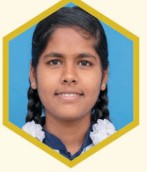
अन्नपूर्णा खोत ९४.००% सरस्वती हाय., टाकळीवाडी