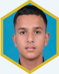
स्वस्तिक नाके ९०.६०% म. न. आश्रम, कारंजा

* गुरुकुलातील प्रथम क्रमांकप्राप्त विद्यार्थी - सर्व यशस्वितांचे हार्दिक अभिनंदन..!!!