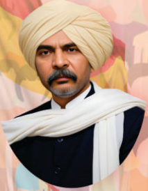
कीर्तन सम्राट तात्यासाहेब चोपडे