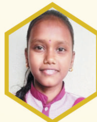
सुरक्षा जाधव ८५.७६% सन्मती विद्या., सिदनाळ