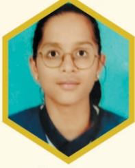
साची तेरदाळे ९९.००% एम. जी. शहा, बाहुबली