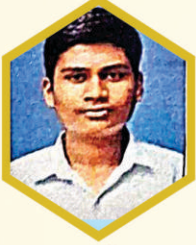
अल्फाज मुगळे ९३.४०% विद्यासागर हाय., अक्विाट